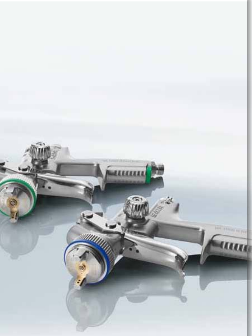
Für spezielle Anforderungen, wie z. B. die Heizkörperlackierung, gibt es praktisches Zubehör.